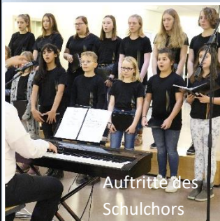
Auftritte des Schulchors