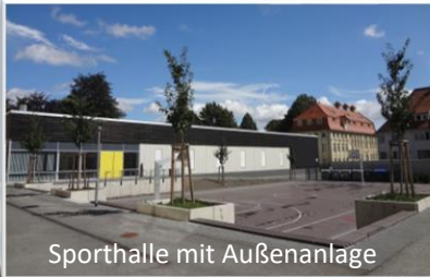
Sporthalle mit Außenanlage

Die Adam-Olearius-Schule in Aschersleben ist eine staatlich anerkannte Gemeinschaftsschule in freier Trägerschaft. Unsere Unterrichtsräume, der Pausenhof sowie die Sporthalle befinden sich auf dem Campus Bestehornpark.