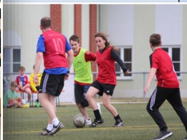
Nur zum Sportfest: Lehrer gegen Schüler