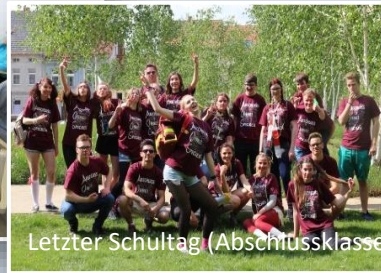
Letzter Schultag (Abschlussklasse)