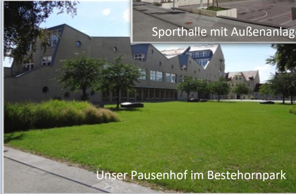
Unser Pausenhof im Bestehornpark